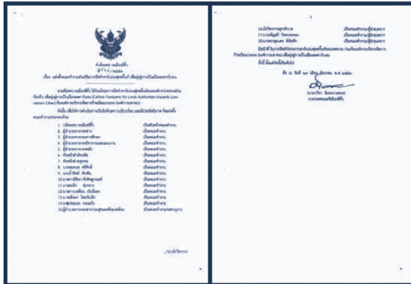
รูปที่ 3 ตัวอย่างประกาศแต่งตั้งคณะทำงานการจัดทำรายงานข้อมูลการปล่อยก๊าซเรือนกระจกขององค์กรปกครองส่วนท้องถิ่น

องค์กรปกครองส่วนท้องถิ่นที่ต้องการจะทำรายงานข้อมูลการปล่อยก๊าซเรือนกระจกขององค์กร ควรกำหนดผู้รับผิดชอบหลักและสร้างคณะทำงาน ทั้งนี้ องค์กรปกครองส่วนท้องถิ่นควรแต่งตั้งคณะทำงานพร้อมทั้งกำหนดบทบาทหน้าที่และสื่อสารให้ผู้ที่เกี่ยวข้องรับทราบ